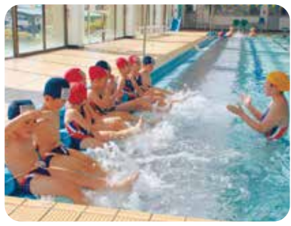
まずはプールサイドに腰かけて水に慣れましょう。