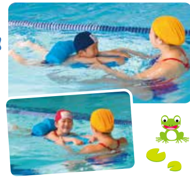
コーチの補助でビート板でバタ足