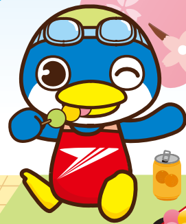
マスコットキャラクター トップくん