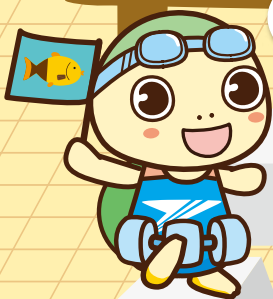
マスコットキャラクター トップくん