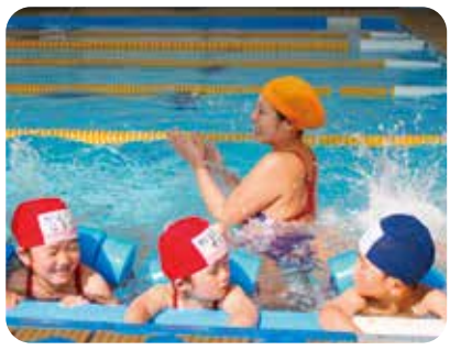
慣れてきたらプールにぎぶん?? 壁に手をかけてバタ足!!