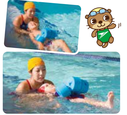
おねんねキックでゆ〜らゆ〜