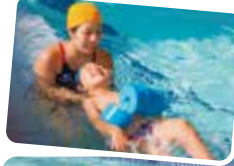
おねんねキックでゆ〜らゆら〜