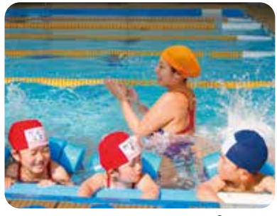
慣れてきたらプールにぎぶん?? 壁に手をかけてバタ足!!