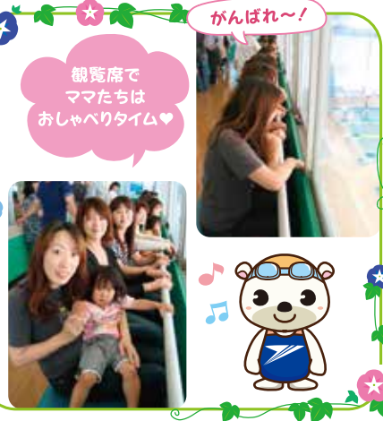
観覧席で ママたちは おしゃべりタイム♡