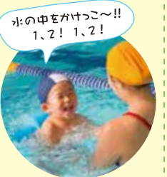
水の中をかけたっ〜!! 1、2! 1、2!

従来型の練習方法と比較し、浮いていることが 困難な小さなお子様でも、泳法の練習を することができます。 水への恐怖心を少しでも取り除き、早い時期 から手足だけでなく全身をバランスよく動か して鍛えることができます。