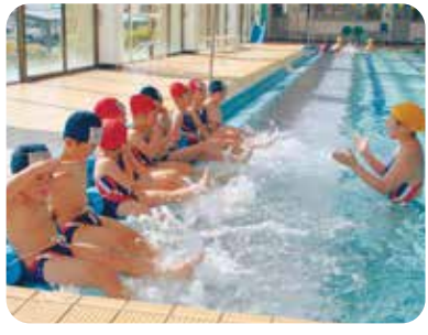
まずはプールサイドに腰かけて 水に慣れましょう。