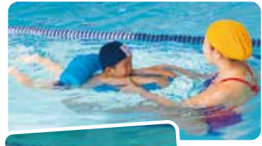
コーチの補助でビート板でバタ足