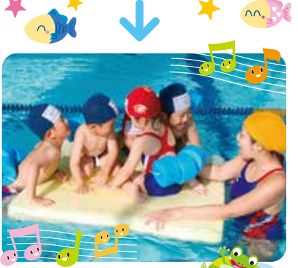
練習後はみんなで プール遊び