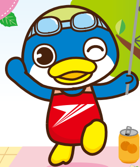
マスコットキャラクター トッピーくん