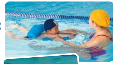
コーチの補助でビート板でバタ足