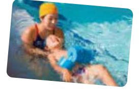
おねんねキックでゆ〜らゆ〜ら